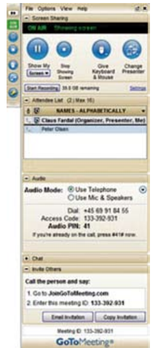
Eksempel på kontrolpanel fra Citrix GoToMeeting™

Mødelederen opretter og styrer møder via kontrolpanelet. Via kontrolpanelet styre også, hvem som deltager med forskellige rettigheder, telefonnummer til etablering af fællestelefonmøde, optagelse af hele seancen.